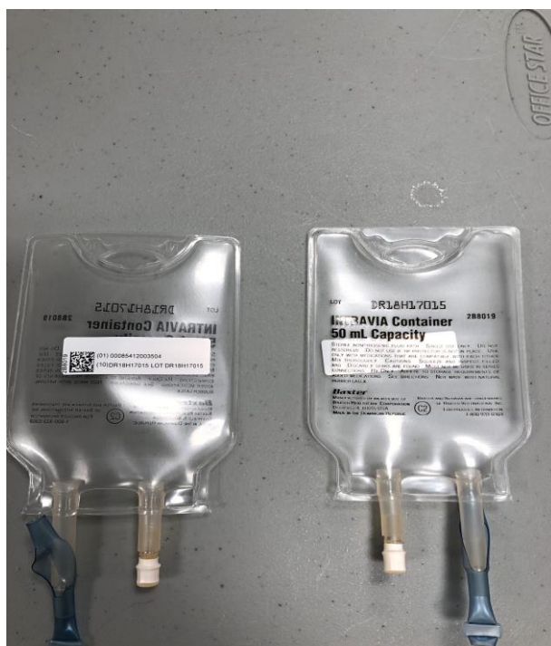
Tomme fleksible 50 ml poser (minibags)