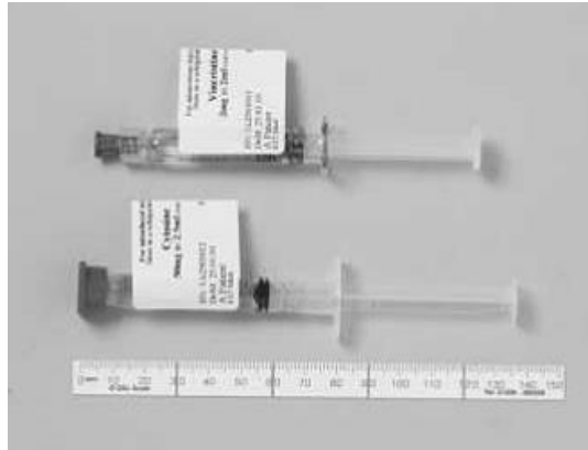
سيتارابين بحقنة النخاع الشوكي و فينكريستين بحقنة الوريد

فينكريستين هو واحد من عائلة الفينكا الكالويد (الأخرون مثل فينبلستين، فينوريلين، وفيندرستين)؛ تستخدم هذه الأدوية في العلاج الكيميائي للسرطان. ينبغي إعطاء هذه الأدوية عن طريق الحقن بالوريد 5 . عندما يتم حقنها عن طريق الحقن بالنخاع الشوكي، فإن هذه الأدوية تسبب مشاكل في التنفس، اختلال في وظائف المخ والحبل الشوكي، والموت. اعتمادا على البروتوكول، فإن التعريف الخاطئ لحقنه الفينكريستين كأنها حقنه دواء آخر يتم اعطائه عن طريق النخاع الشوكي كحقنه السيتارابين لا يزال يعرض المرضى للخطر بسبب النتائج القاتلة. بالإضافة إلى ذلك، فإن القدرة على التعافي من هذه حاله قليلة جدا، مما يجعل منع هذه الأحداث أمرا ضروريا.